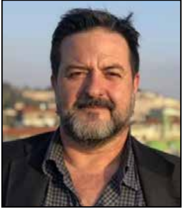
عضو البرلمان الأوروبي مانو بينيدا

وأشار إلى أن الأسرى المضربين عن الطعام هم رهن الاعتقال الإداري، وقد حرّموا من حقهم في محاكمة عادلة وحرّة، مؤكداً أنه من الضروري أن تضع سلطات الاحتلال حداً لممارسة الاعتقال