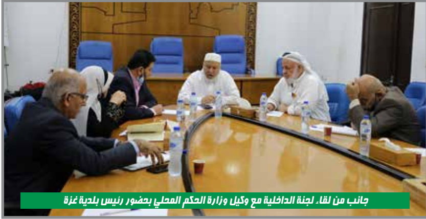
جانب من لقاء لجنة الداخلية مع وكيل وزارة الحكم المحلي بحضور رئيس بلدية غزة