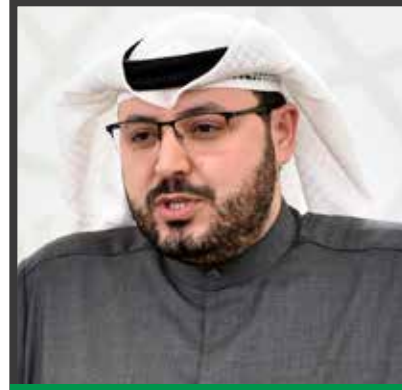
النائب الكويتي عبد العزيز مارق المقعبي