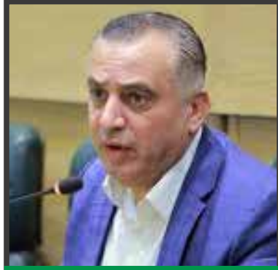
النائب الأردني محمد الظهراوي