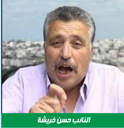
النائب حسن خريشة