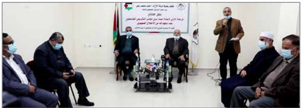
جانب من حفل افتتاح التشريعي للمبنى

وأكد بحر: على أن المجلس التشريعي مستمر في عمله التشريعي والرقابي والنيابي والدور الوطني والدبلوماسي خدمة للمجتمع الفلسطيني الذي انتخب نوابه وحملهم الأمانة، مشدداً على أن التشريعي مع المصالحة الفلسطينية الوطنية ويدعمها بكل قوة وهو أيضاً مع إجراء الانتخابات التشريعية والرئاسية والمجلس الوطني التي من شأنها أن تضمن تجديد الشرعيات للمؤسسات الوطنية والنظام السياسي كافة،