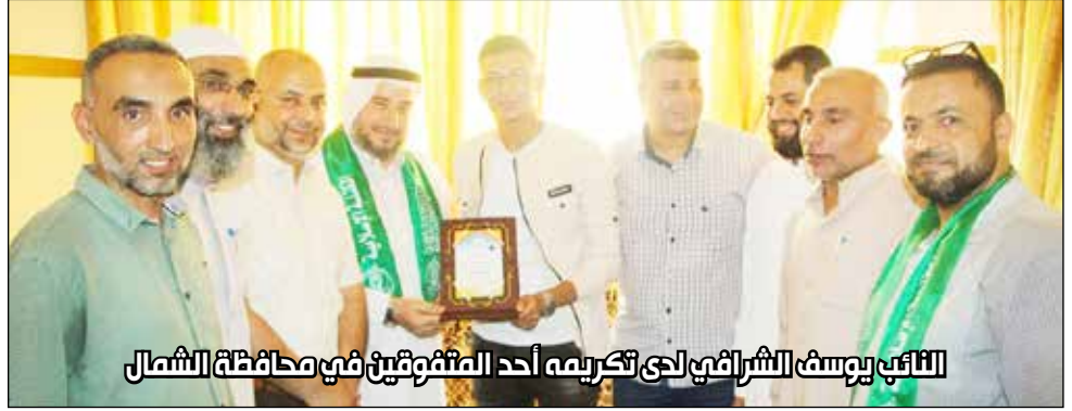
النائب يوسف الشرافي لدى تكريمه أحد المتفوقين في محافظة الشمال

بإنجاز المتفوقين، مؤكداً أن هذا التفوق يعد الخطوة الأولى لخدمة وطنهم وقضيتهم، وإفشال مخططات الاحتلال الرامية لإيجاد جيل جاهل.