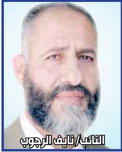
النائب/ ناييف الرجوب

ودعا الرجوب، لإجراء انتخابات تشريعية ورئاسية ومجلس وطني بشكل متزامن في أقرب فرصة ممكنة للتجديد الشرعي والخروج من حالة الانقسام والبدء الفوري بتوحيد المؤسسات الوطنية في جناحي الوطن.