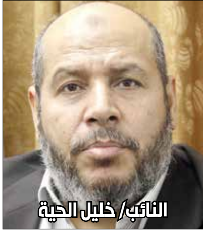
النائب/ خليل الحية

وقال الحية -في تصريح حصلت البرلمان على نسخة منه-: "لا مكان في بلدنا إلا للقانون والمقاومة، ولن نسمح لأي كان أن يمس بالمقاومة